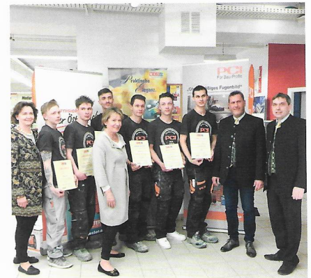
Die stolzen Sieger des Champions Day.